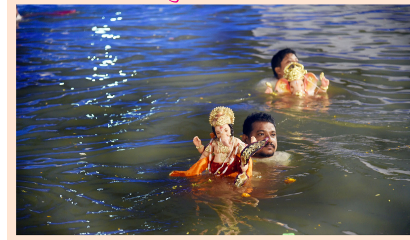
गणपती बाप्पा मोरया पुढल्या वर्षी लवकर या असा जयघोष करत दीड दिवसांच्या लाडक्या गणरायला गणेश भक्तांनी मनोभावे पाहुणचार करून निरोप दिला. ठाण्यातील रायलादेवी तलाव येथील कृत्रिम तलावात गणेश मूर्ती विसर्जन करण्यात आल्या.....