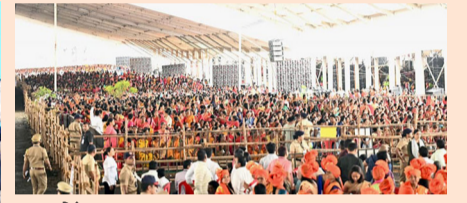
केंद्र सरकारची लखपती दीदी योजना ... (सविस्तर वृत्त पान २)