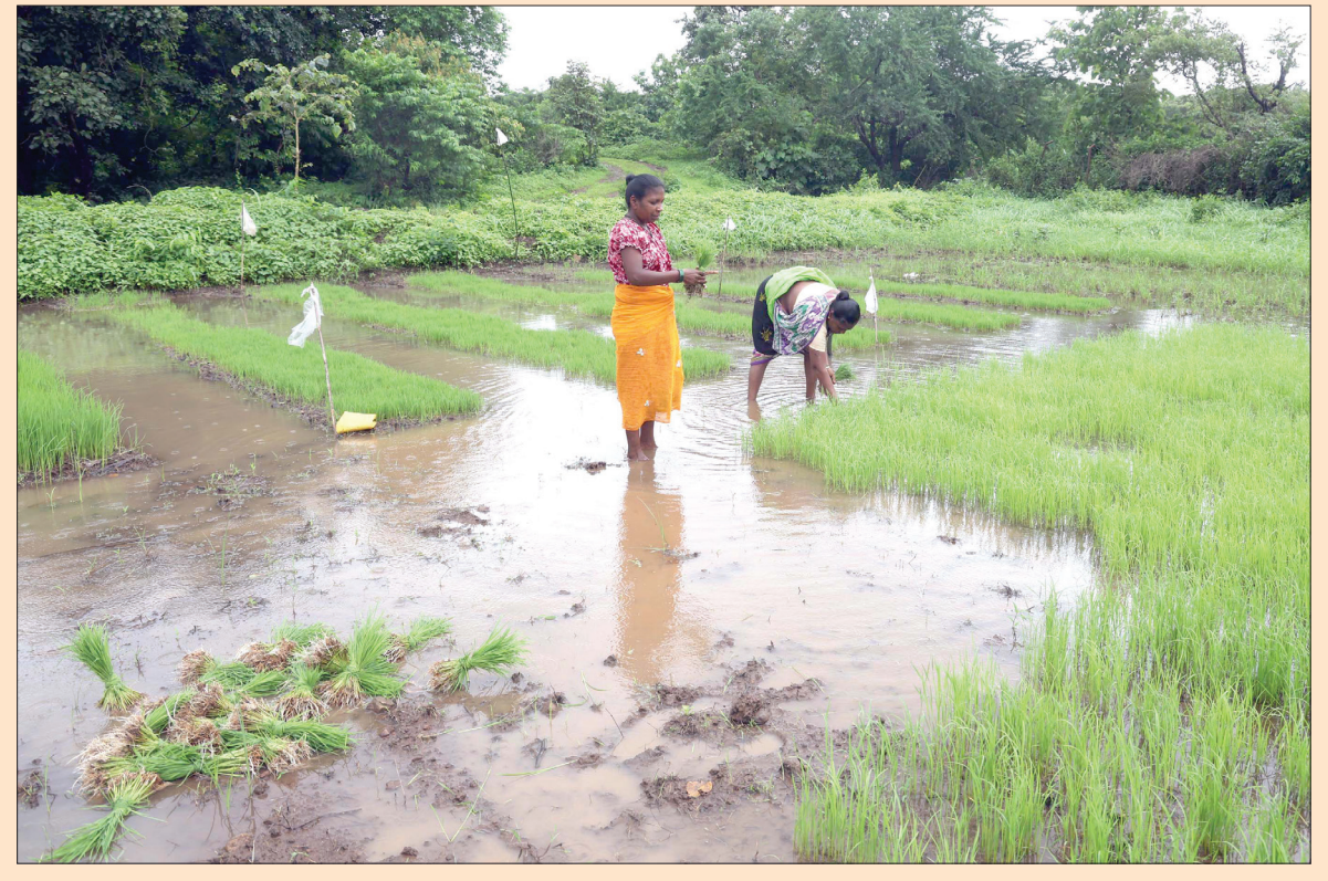
ठाण्यातील येथूर गावात भात शेती मध्ये महिला भात पेरणी करताना महिला तसेच अत्याधुनिक पदाथने मशीन ने शेती करताना दिसत आहे.

कल्याण डोंबिवली पालिका हद्दीतील बहुतांश होर्डिंग ही ठाण्यातील काही राजकीय मंडळींच्या आशीर्वादाने अनेक वर्षे लावली जात आहेत. या होर्डिंगवर कारवाई न करण्याचे अलिखित संकेत वरिष्ठांना आहेत. त्यामुळे पालिका अधिकारी माहिती असूनही अशा बेकायदा होर्डिंगवर कारवाई करण्यासाठी जात नसल्याचीही माहिती समोर आली आहे. महापालिकेतील वरिष्ठ अधिकारी कनिष्ठ अधिकाऱ्यांना फक्त आदेश देतात. त्यामुळे कनिष्ठ अधिकारी आदेशाचे पालन करून गप्प बसतात. आपल्या आदेशाचे कठोर पालन होते की नाही याची चाचणी वरिष्ठ करत नसल्याची माहिती आहे.