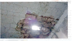
कल्याण नगर मार्गावरील शाहाड पूलाला भगदाड ...पान ४ वर