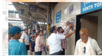
रेल्वे स्वच्छतागृह कंत्राटदाराकडून मुतारीसाठीही पैसे वसुली ...पान ५ वर