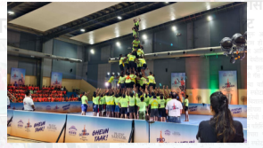
प्रो गोविंदा सीझन २ ची पूर्व पात्रता फेरी मॅन्स्टिक सेंटर वेधे संपन्न

अग्रलेख लोकांची हतबलता सर्वसामान्य माणूस हा लोकशाहीचा मुख्य घटक आहे. यामध्ये सर्व सामान्य माणसाने राजकीय परिस्थितीवर बोलणे अपेक्षित असते. असा राजकीय परिस्थितीवर भाष्य करणारा मध्यमवर्गीय माणूस सध्या दुर्मिळ झाला आहे. .....पान ४ वर