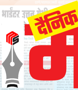
मुंबई, मुंबई उपनगर, ठाणे, नवी मुंबई, रायगड, पालघर आणि पुणे येथून प्रसिद्ध