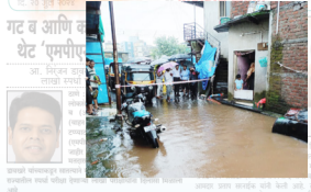
अतिवृष्टीच्या पार्श्वभूमीवर महापालिकेची आपत्कालीन मदत यंत्रणा कार्यरत ...पान ६ वर