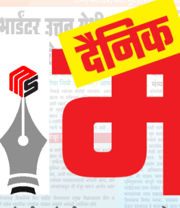
मुंबई, मुंबई उपनगर, ठाणे, नवी मुंबई, रायगड, पालघर आणि पुणे येथून प्रसिद्ध