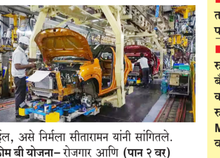
होईल, असे निर्मला सीतारामन यांनी सांगितले. स्कीम बी योजना- रोजगार आणि (पान २ वर)

खाजगी क्षेत्राच्या सहकार्याने ई-कॉमर्स निर्यात केंद्र तयार केले जाईल आणि तरुणांच्या इंटरनॅशनल सर्वसमावेशक योजना आणली जाईल.