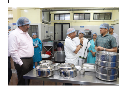
मध्यान जेवणाच्या स्वयंपाक घरात आयुक्तांची भेट...