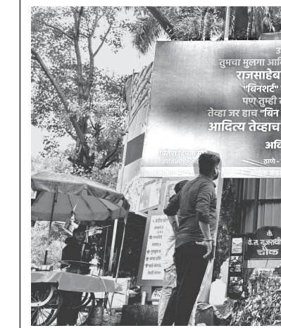
बिनशर्त नाही, बिनशर्त पाठिंबा', उद्धव ठाकरेंनी राज ठाकरेंची खिळी उडवल्यानंतर ठाण्यात मनसैनिकांचे बॅन बाजीतून प्रत्युत्तर...