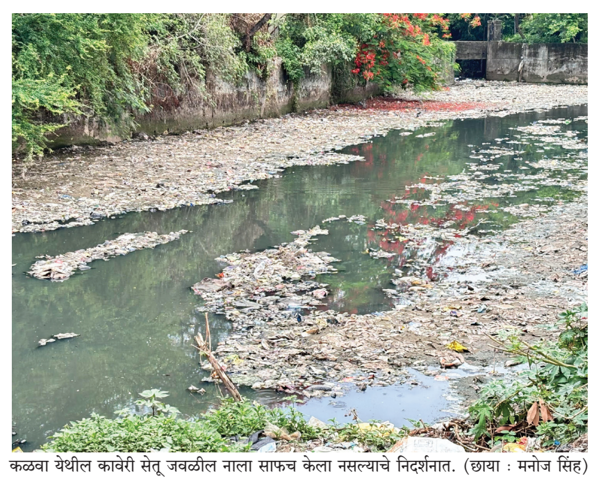
कळवा येथील कावेरी सेतू जवळील नाला साफच केला नसल्याचे निदर्शनात.