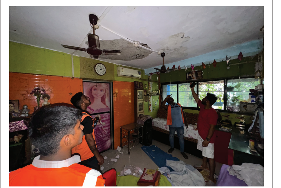
कोपरी येथील मीठबंदर रोड येथील श्रमदान सोसायटी बिल्डिंग ३ च्या तिसऱ्या मजल्यावरील प्लास्टर पडल्याने बिल्डिंग सील करण्यात आली.