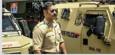
दिसतोय. त्याच्या पाठी उभ्या असलेल्या अनेक

बॉलीवुड अभिनेता अजय देवगणचा नाव घेतलं की त्याची 'सिंघम' व्यक्तिरेखा डोळ्यासमोर आल्याशिवाय राहत नाही. हाच प्रेक्षकांचा लाडका सिंघम पुन्हा एकदा आपल्या भेटीला येण्यासाठी सज्ज झालाय. अजय देवगण पुन्हा एकदा 'सिंघम अगेन' या चित्रपटातून आपल्याला इंडियन पोलिसांच्या भूमिकेत दिसेल. त्याच्या या आगामी चित्रपटाचे चित्रीकरण सध्या जम्मू-काश्मीर मध्ये सुरु झाले आहे. या चित्रपटातील अजय देवगणचा पहिलाच लूक चाहत्यांसमोर आला आहे. अजय देवगणसोबतच अक्षयकुमार, रणवीर सिंग, टायगर श्राॅफ, करीना कपूर, दीपिका पदुकोण आणि अर्जुन कपूर यांच्याही या सिनेमात महत्त्वपूर्ण भूमिका आहेत. 'सिंघम अगेन'चे दिग्दर्शक रोहित शेट्टी यांनी शुक्रवारी या चित्रपटातील अजय देवगणची पहिली झलक आपल्या सोशल मीडिया अकाऊंटवरून शेअर केली आहे. या लूकमध्ये अजय देवगण सिंघमच्या रुपात अवतरलेला