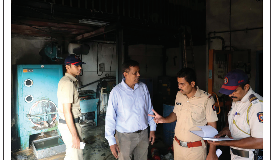
वागळे इस्टेट, रोड नं.१४ हाजुरी येथील रेप्रोफ्लेक्स - ३ इंडिया प्रा. लि. या कंपनीमध्ये रबर फ्लेक्स बनविणाऱ्या मशिनला आग लागली होती.