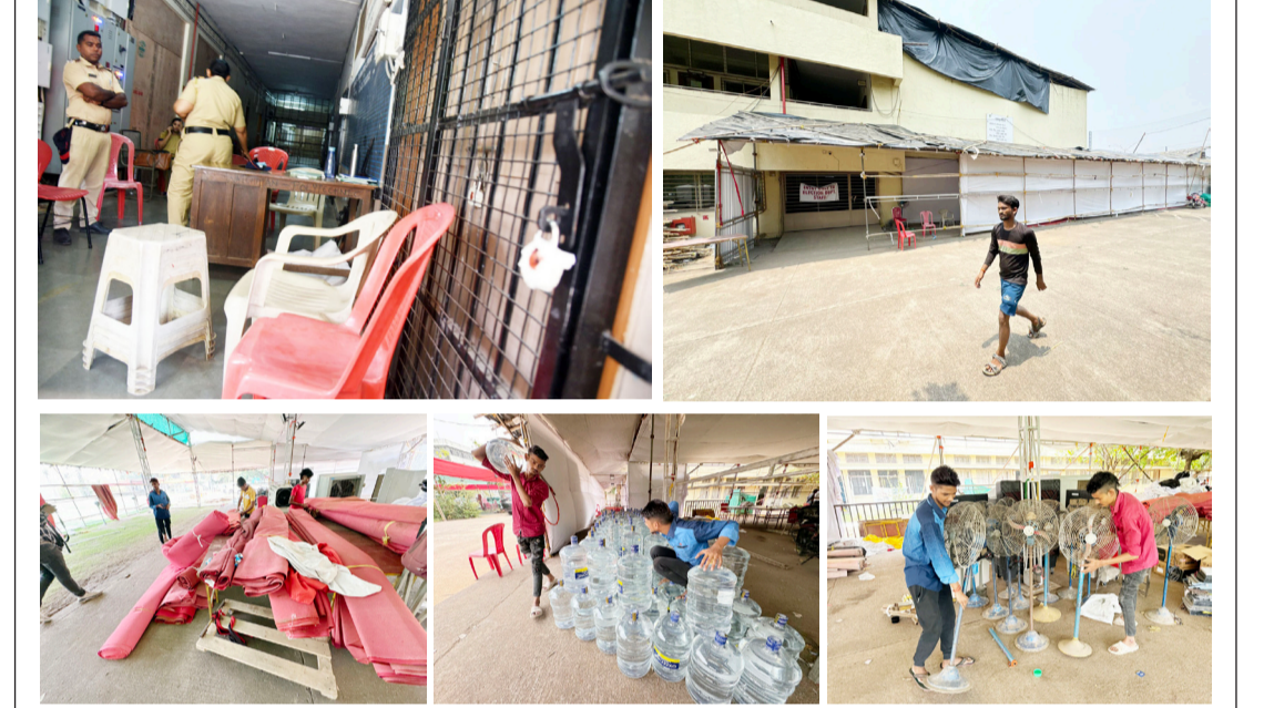
आज होणाऱ्या लोकसभेचे निवडणुकीतील पाचव्या टप्प्याचे मतदान असल्यामुळे मतदान केंद्रावर निवडणूक आयोगातर्फे योग्य ती खबरदारी घेतली जात आहे. मतदानात मतदान केंद्रावर येण्यापूर्वीची तयारीसाठी सुरु असलेली लागवट... याचे क्षणचित्र...